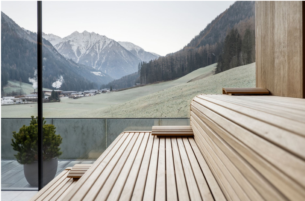
Alpine Luxury Spa Resort Schwarzenstein

Die Sehnsucht nach Ruhe, Erdung und echter Regeneration war selten so groß wie heute. In einer Zeit permanenter Reizüberflutung und digitaler Dauerpräsenz wird Wellness neu gedacht: leiser, bewusster und vor allem naturnah. Im Zentrum dieser Entwicklung steht das Biophilic Design, ein Gestaltungsansatz, der die Natur zurück in unsere Lebensräume holt. Was zunächst wie ein ästhetischer Trend erscheint, ist in Wahrheit wissenschaftlich fundiert und hat tiefgreifende Auswirkungen auf unser Wohlbefinden. KLAFS, Weltmarktführer für Sauna, Wellness und Spa, zeigt, wie sich daraus ganzheitliche Spa-Konzepte entwickeln lassen, die Körper und Geist nachhaltig positiv beeinflussen.