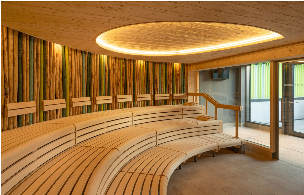
Main Bad Bornheim

Biophilic Design ist mehr als ein gestalterisches Konzept – es ist Ausdruck eines veränderten Lebensgefühls. In einer zunehmend digitalen Welt wächst das Bedürfnis nach echten, sinnlichen Erfahrungen und einer stärkeren Verbindung zur Natur. KLAFS übersetzt diese Sehnsucht in Räume, die multisensorisch wirken, wissenschaftlich fundiert gestaltet sind und sich individuell anpassen lassen. Es entstehen Orte, die Geborgenheit schenken, aktiv zur Regeneration beitragen und den Menschen wieder in Einklang mit der Natur bringen – ein Ansatz, der die Wellnessarchitektur nachhaltig prägt und neue Maßstäbe setzt.