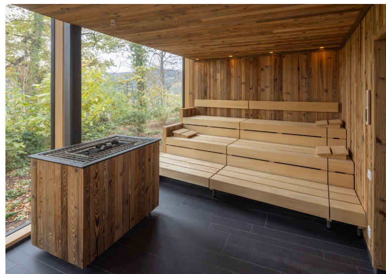
Luisenhöhe Gesundheitsresort Schwarzwald

Im Zentrum dieses Ansatzes steht die bewusste Integration natürlicher Elemente in Architektur und Innenräume. Der Mensch ist evolutionär eng mit der Natur verbunden und reagiert entsprechend stark auf Materialien wie Holz und Stein, auf Tageslicht oder natürliche Texturen. Warme Holzöne, behagliches Licht, angenehme Haptiken oder feine Düfte wirken beruhigend und fördern ein Gefühl von Geborgenheit. KLAFS integriert deshalb natürliche Lebensräume gezielt in die Planung von Wellnesslandschaften: Hochwertige Hölzer mit lebendiger Optik und natürlicher Maserung, großzügige Glasflächen, die Tageslichteinfall und den Blick ins Grüne ermöglichen, sowie fließende Übergänge zwischen Innen- und Außenraum werden bewusst eingesetzt. Auch archaische Elemente wie Feuer und Wasser spielen eine zentrale Rolle. Ihre sinnliche Qualität – die wohltuende Wärme, die Bewegung von Wasser oder die Kühle von Eis – spricht tief verankerte Wahrnehmungsmuster an und unterstützt die Regeneration auf emotionaler und körperlicher Ebene. Diese Gestaltungskonzepte vermitteln Ursprünglichkeit und stehen für eine Rückkehr zu den Wurzeln, die beim Design von Wellnessräumen zunehmend an Bedeutung gewinnt.